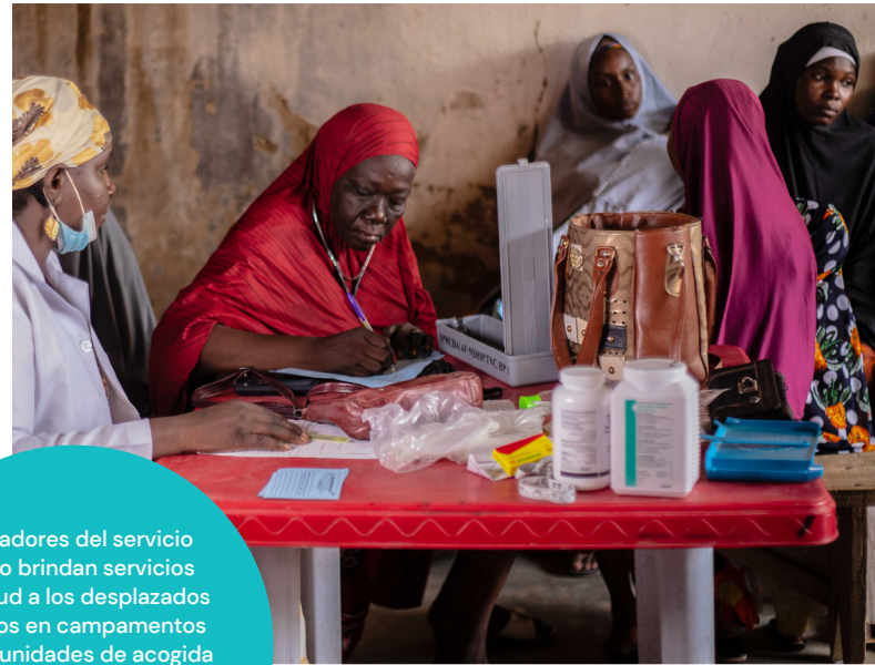
Trabajadores del servicio público brindan servicios de salud a los desplazados internos en campamentos y comunidades de acogida en los estados del noreste de Nigeria.

Una problemática clave, pero menos discutida, que determina la respuesta fiscal de un país es la calificación crediticia. Benmelech and Tzur-Ilan (2020) explican que las calificaciones crediticias soberanas antes de la crisis eran el factor más relevante que afectaba la política fiscal de un país durante la pandemia de Covid-19. Esto es cierto no solo en los LMIC, sino también en los países de ingresos altos (HIC). Es decir, incluso en economías avanzadas de ingresos altos, la calificación crediticia de un país afecta su