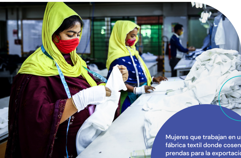
Mujeres que trabajan en una fábrica textil donde cosen prendas para la exportación en Dhaka, Bangladesh.

La tercera lección importante es que los países deben fortalecer sus entes reguladores e instituciones financieras y permitirles controlar la elaboración de políticas sin la interferencia de políticos. La independencia de las instituciones monetarias es fundamental para el control de la inflación y la sostenibilidad fiscal. Estas limitaciones estructurales dificultaron la implementación eficaz de políticas económicas en los LIC, por lo que es necesario abordarlas (Adeniran 2020). Contar con instituciones financieras sólidas puede ayudar a mantener la calidad de activos: un factor esencial a la hora de determinar la cantidad de apoyo fiscal que se puede brindar durante las crisis y contracciones económicas. Por ejemplo, en Kenia, la organización International Monetary Fund (IMF) determinó que la pandemia había agravado las deficiencias preexistentes de la calidad de activos en el sector bancario. La proporción de préstamos improductivos de los bancos aumentó del 12,7 por ciento en febrero de 2020 al 14,1 por ciento en diciembre del mismo año (Raga and te Velde 2022), lo cual afectó la capacidad del país para responder adecuadamente a los impactos de la pandemia.