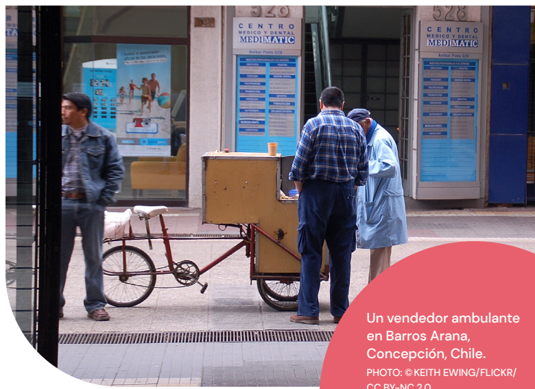
Un vendedor ambulante en Barros Arana, Concepción, Chile.

Para obtener futuras respuestas eficaces a desastres y crisis, se necesitan datos sólidos y desagregados por género del número de grupos marginados (incluidos los trabajadores migrantes) para asegurar de que la ayuda alcance a quienes más la necesitan. Por ejemplo, en junio de 2021, la Corte Suprema de la India ordenó a todos los estados acelerar los registros de los trabajadores informales en National Database for the Unorganized Workers (NDUW) para garantizar que los trabajadores migrantes tengan acceso a los distintos esquemas de beneficios sociales del gobierno central y los gobiernos de los estados (Pillai et al. 2022d). Los datos sólidos y prácticos son necesarios para comprender mejor el alcance y el impacto de los esquemas gubernamentales y los indicadores de exclusión (Pillai et al. 2022a).