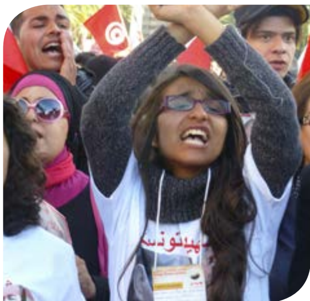
Joven mujer tunecina en la marcha inaugural del Foro Social Mundial, Túnez, marzo de 2013.

En todo el mundo hay una activa demanda desde las masas para que se ponga fin a la injusticia de género en todos los ámbitos de nuestras vidas sociales, económicas, políticas y culturales. Los movimientos sociales – liderados por activistas y movimientos feministas, de mujeres y a favor de la justicia de género – han sido fundamentales en exigir, producir y mantener estos cambios. Sin embargo, aunque los derechos de las mujeres y la justicia de género están ‘en la agenda’ en muchos ámbitos, las y los activistas continúan enfrentando una fuerte resistencia a cambiar las políticas y prácticas en materia de género dentro de los movimientos y las organizaciones relacionadas con éstos.