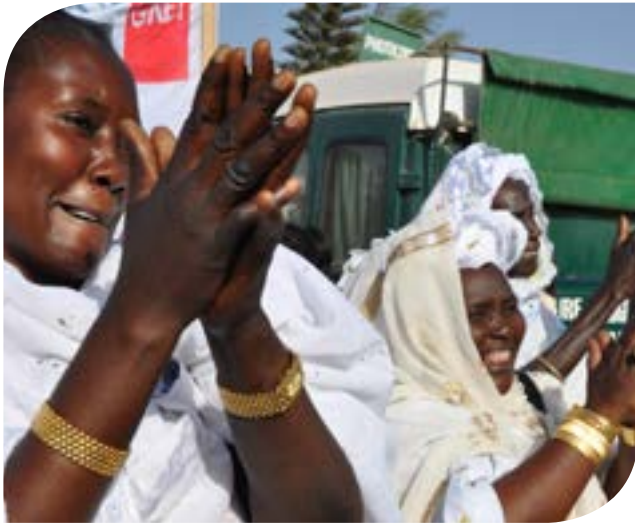
Mujeres marchan por la igualdad de género en Dakar, Senegal, 2011.