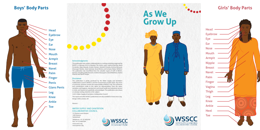
« As We Grow Up ».

contextes, par exemple, ce qui touche à l'incontinence ou un besoin plus fréquent d'uriner. En novembre 2014 dans le camp de Zaatari, en Jordanie, les couches pour adulte étaient coûteuses et/ou indisponibles, et une famille qui s'occupait d'un homme âgé souffrant d'incontinence fut contrainte d'improviser avec des guenilles et des draps en plastique (Venema 2015).