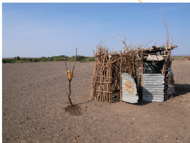
Latrine et abri de douche + installation de lavage des mains, Jeldi, Éthiopie.

La Sanitation Learning Hub (SLH), l'UNICEF et WaterAid ont commandité une étude pour cartographier les approches d'assainissement rural dans des contextes difficiles et les lignes directrices actuellement utilisées, afin de voir les expériences et enseignements qui s'en dégagent. L'état des lieux initial identifie des lacunes qu'il faut combler et formule des recommandations sur la manière de remédier à certaines d'entre elles. Les trois organisations commanditaires entendent travailler avec l'ensemble du secteur afin d'explorer les lacunes et les opportunités de façon plus détaillée lors d'une deuxième phase de ces travaux.