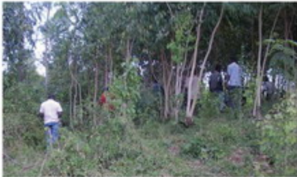
(বিশ্ব) ইন্ডোনেশিয়া আম্বনের কাছ প্রাচীর কমিউনিটি CO গ্রাম পরিচালনা করা হচ্ছে সেখানে যুগে যুগে।