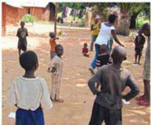
শুধুমাত্র একটি উদ্যোগের মাধ্যমে নিজস্বের জীবন যাপনের সময় তারা যে প্রোগ্রাম নিয়ে নিয়ে যাবে সেসবের প্রোগ্রাম তৈরি করতে তাদের সাহায্য করবে। যতদূর তা সচেতনতা তৈরি মাঝে মাঝে তারা তাদের জন্য প্রেরণ দেওয়া হবে। শুধুমাত্র এরা শান্তি ও উৎসাহের মাধ্যমে এই শর্তের সাহায্যের মাধ্যমে পারবে।