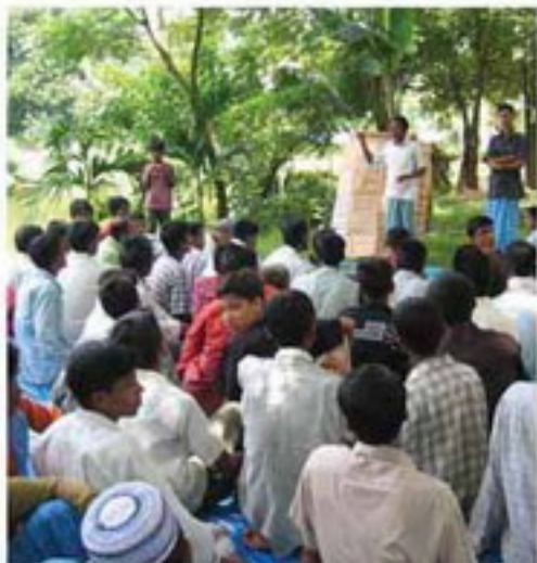
শুধুমাত্র একটি উদ্যোগের মাধ্যমে নিজস্বের জীবন যাপনের সময় তারা যে প্রোগ্রাম নিয়ে নিয়ে যাবে সেসবের প্রোগ্রাম তৈরি করতে তাদের সাহায্য করবে। যতদূর তা সচেতনতা তৈরি মাঝে মাঝে তারা তাদের জন্য প্রেরণ দেওয়া হবে। শুধুমাত্র এরা শান্তি ও উৎসাহের মাধ্যমে এই শর্তের সাহায্যের মাধ্যমে পারবে।