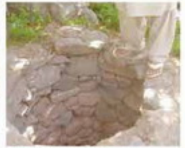
উন্নত শৌচবিহীন মৌসুমের একটি মডেল... উন্নত শৌচবিহীন মৌসুমের একটি মডেল...