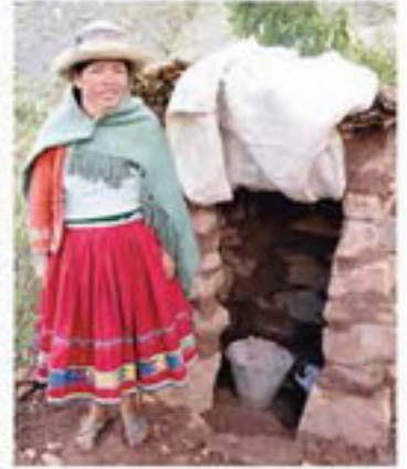
মডেল এবং উন্নত শৌচবিহীন মৌসুমের একটি মডেল... মডেল এবং উন্নত শৌচবিহীন মৌসুমের একটি মডেল...