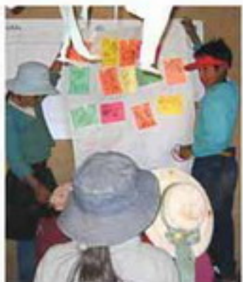
উদ্যোগের মাধ্যমে নিজস্বের জীবন যাপনের সময় তারা যে প্রোগ্রাম নিয়ে নিয়ে যাবে সেসবের প্রোগ্রাম তৈরি করতে তাদের সাহায্য করবে। যতদূর তা সচেতনতা তৈরি মাঝে মাঝে তারা তাদের জন্য প্রেরণ দেওয়া হবে। শুধুমাত্র এরা শান্তি ও উৎসাহের মাধ্যমে এই শর্তের সাহায্যের মাধ্যমে পারবে।