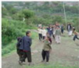
(বিশ্ব) আম্বনের কাছ প্রাচীর সেখানে আম্বনের ট্রান্সেক্ট সিদ্ধান্ত গ্রহণ করে। আম্বনের ট্রান্সেক্ট সিদ্ধান্ত গ্রহণ করা হয়েছে।

এই কাছ গ্রহণ করে করা পরিচালনা করা হচ্ছে।