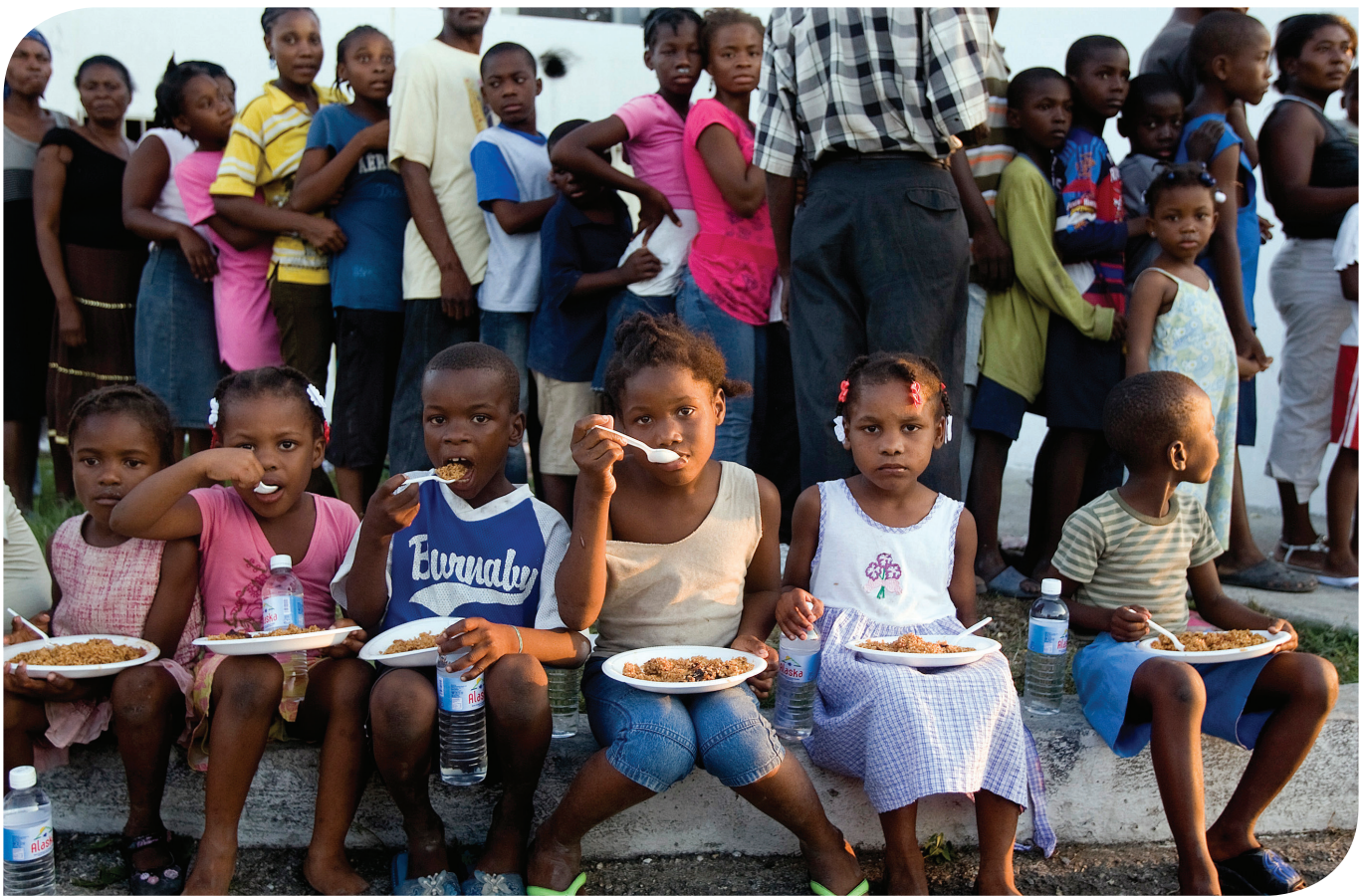
Enfants recevant un repas à la Cité Soleil