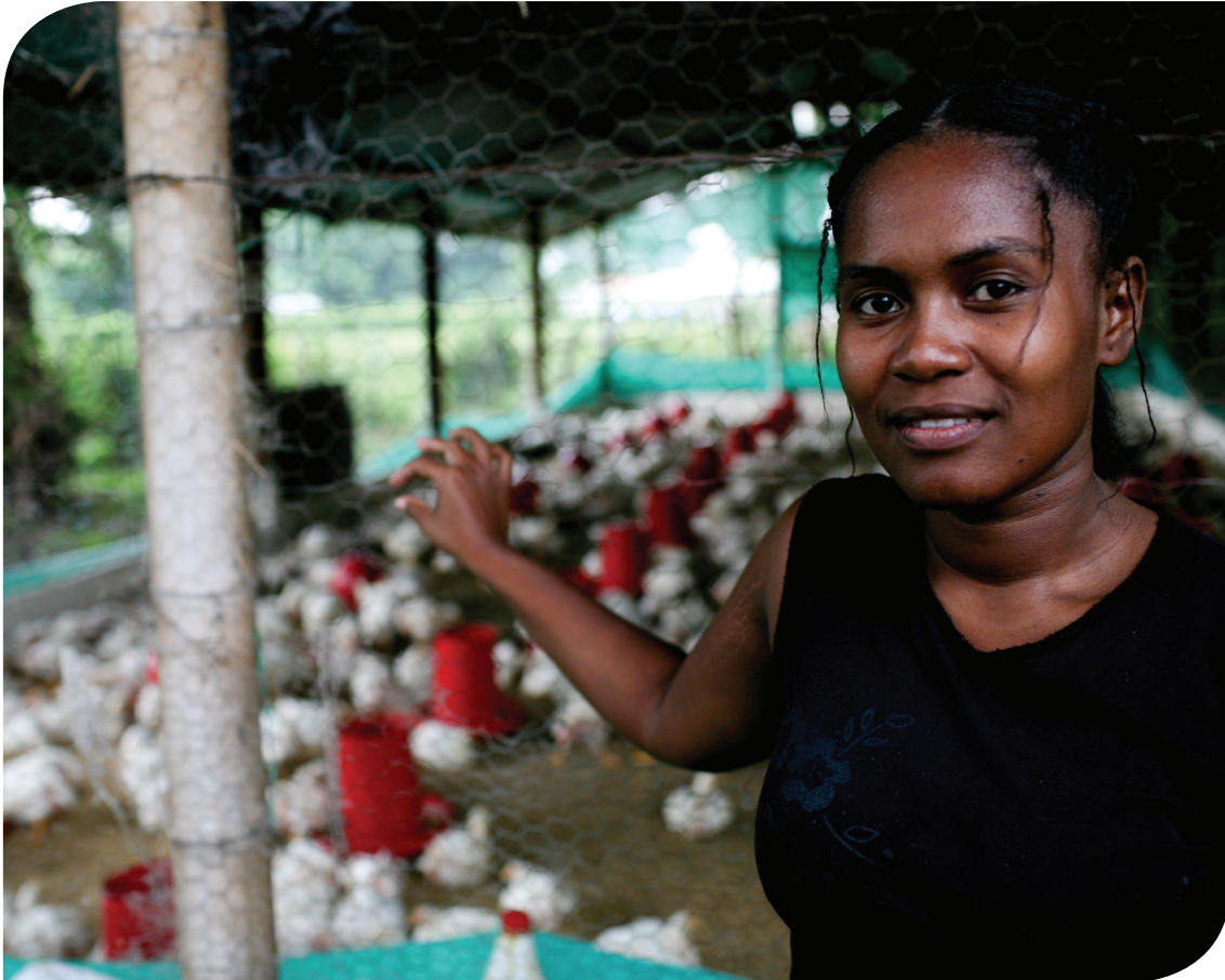
Elevage de volailles en Colombie