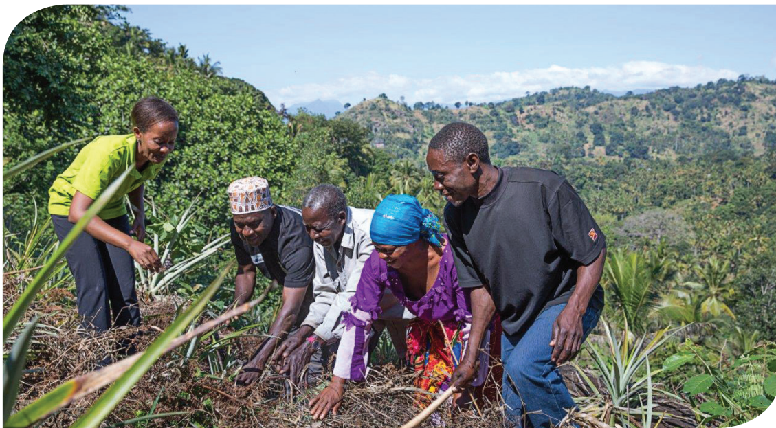
Formation aux techniques agricoles améliorées du Réseau des Groupes des Petit-e-s Exploitant-e-s Agricoles de Tanzanie, Morongoro, Tanzanie

Le phénomène de l'insécurité alimentaire, qu'on a appelé au cours du Sommet mondial sur la sécurité alimentaire de 2009 « notre performance tragique en ces temps modernes » 50 , est en train d'interpeller les décideurs aux niveaux mondial, régional et national. Des processus de haut niveau, impliquant de multiples intervenant-e-s, ont été mobilisés pour identifier des réponses urgentes au problème de la faim et la malnutrition. Celles-ci peuvent être classées en deux catégories associées : 'l'action directe' sous forme d'aide alimentaire et d'interventions de protection sociale pour les plus vulnérables ; et les actions à plus long terme telles que l'augmentation de la productivité agricole et la promotion du commerce mondial et régional pour « construire la résilience et s'attaquer aux causes profondes de la faim » (CSA 2013 :15). Ces stratégies à plus long terme ont de nouveau mis l'accent sur la production agricole et les petit-e-s paysan-ne-s, les considérant comme les protagonistes principaux d'un « cycle vertueux » de croissance économique et de sécurité alimentaire.