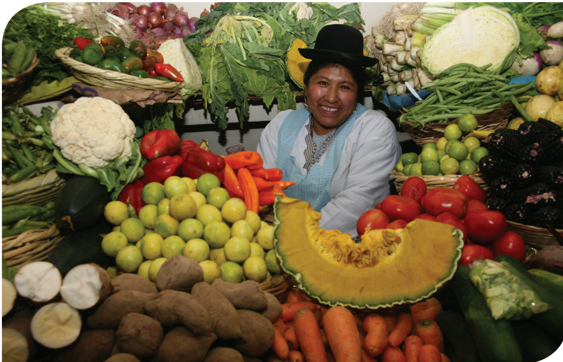
Biodiversité de l'agriculture sur un marché péruvien