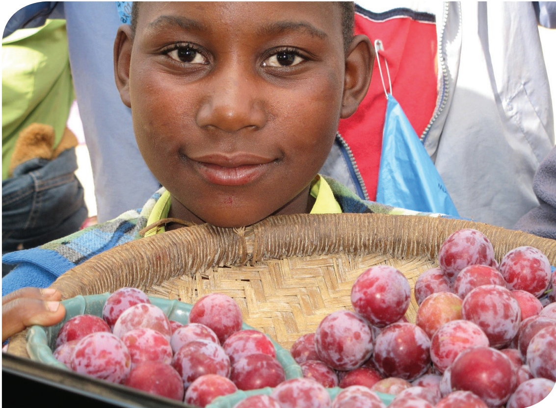
Jeune fille vendant des prunes au bord de la route, Malawi