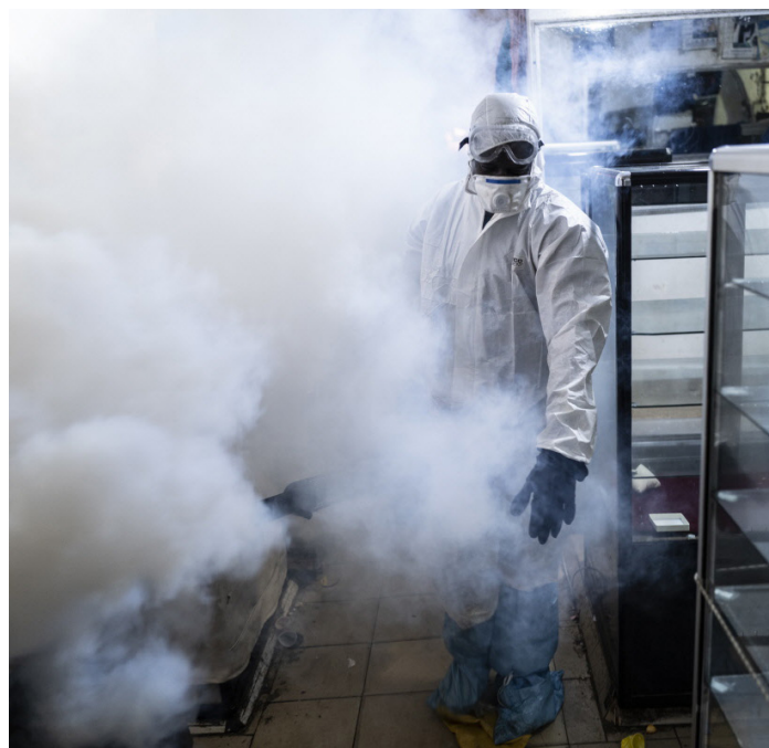
Un trabajador municipal en Dakar, Senegal, usa un fumigador para desinfectar el mercado de Tilene en el barrio de la Medina, mientras afuera, una excavadora demuele negocios informales para detener la propagación del Covid-19.

Ndung'u, N. and Shimeles, A. (2021) 'Trade-Offs between Lockdown Measures to Control the Spread of the Covid-19 Pandemic and the Economic and Social Consequences', paper presented at the virtual 23rd Senior Policy Seminar, AERC, 30 March 2021