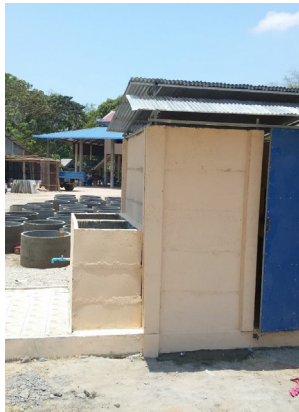
បង្គន់ងាយស្រួល ស្តង់ដារ។ ក្រុម្រឹត៖ IDE Cambodia