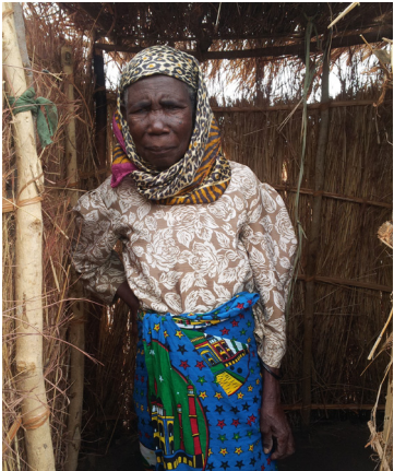
ថ្មីៗនេះ គណៈកម្មាធិការអភិវឌ្ឍន៍ភូមិ បានជួយដល់ជនជាតិ Tabieni ក្នុងការសាងបង្គន់ (ប្រទេសម៉ាលី)។

យើងពិចារណាថា ការគាំទ្រនឹងរួមបញ្ចូលបណ្តាយន្តការ ជំនួយថវិកា ជំនួយសម្ភារៈ និងជំនួយមិនមែនសម្ភារៈ ដែលគ្របដណ្តប់លើសពីដំណើរការគាំទ្រសហគមន៍ដឹកនាំអនាម័យទាំងស្រុងកន្លងមក (ប៉ុន្តែ ច្រើនតែលាយឡំ ជាមួយសមាសភាគទាំងនេះ)។ យើងផ្តោតការយកចិត្តទុកដាក់លើរបៀបរៀបចំយន្តការទាំងនេះ ដើម្បីលើកឡើងពីបញ្ហាប្រឈមរបស់ជន និងក្រុមជួបការលំបាក។ រូប១ បង្ហាញពីយន្តការគាំទ្រជាច្រើន។ ការដាក់បញ្ចូល យន្តការគាំទ្រក្នុងយុទ្ធសាស្ត្រគោលនយោបាយ ថវិកា និងដំណើរការពិនិត្យតាមដានរបស់រដ្ឋាភិបាល និងស្ថាប័នផ្សេងទៀត ជាកត្តាដ៏សំខាន់ក្នុងការផ្លាស់ប្តូរពីការផ្តោតលើគម្រោង ស្តីពីសមធម៌ ទៅជាការផ្តោតលើស្ថាប័នដែលជាចំណុចស្នូលក្នុងរូប១។ ដូច្នេះរដ្ឋាភិបាលមូលដ្ឋាននឹងក្លាយជាគូអង្គស្នូលដែលជំរុញដំណើរការនេះ។