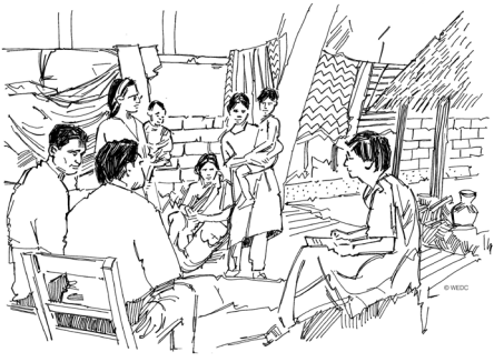
ការជំរុញឱ្យបុគ្គលសំខាន់ៗក្នុងមូលដ្ឋានចូលរួមក្នុងដំណើរការនេះ។

ការធានាសមភាព និងការមិនរើសអើងក្នុងសកម្មភាពអនាម័យ តម្រូវឱ្យទីភ្នាក់ងារគាំទ្រកំណត់អត្តសញ្ញាណជនជួបការលំបាកក្នុងការទទួលបានអនាម័យ (Roaf et al. 2018)។ ដូចការរៀបរាប់ក្នុងផ្នែកទី១ នៃឯកសារនេះ ចាំបាច់ត្រូវមានការកំណត់អត្តសញ្ញាណជន និងក្រុមជួបការលំបាកយ៉ាងត្រឹមត្រូវ ដើម្បីកាត់បន្ថយហានិភ័យ និងដោះស្រាយឧបសគ្គរារាំងជន/ក្រុមជួបការលំបាកក្នុងការសាងសង់ និងថែទាំជួសជុលបង្គន់ ឬកូរូមនឹងការពនិត្យតាមដានលទ្ធផលសម្រាប់ក្រុមជាក់លាក់ទាំងនេះ (House et al. 2017)។