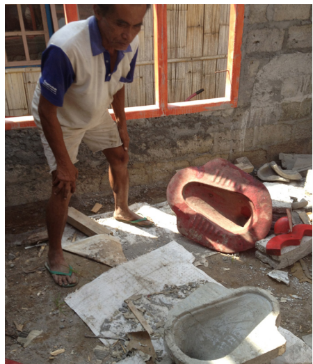
អាជីវកម្មអនាម័យ ផលិតបង្គន់ដែលមានតម្លៃទាបក្នុងប្រទេសឥណ្ឌូនេស៊ីភាគខាងកើត។

បញ្ហាប្រឈម: ស្ថាប័នអាជ្ញាធរមូលដ្ឋានច្រើនតែមានភារកិច្ចធានាការផ្តល់សេវាអនាម័យប៉ុន្តែ ប្រហែលជាមានមិនសូវមានធនធានហិរញ្ញវត្ថុ អំណាចធ្វើសេចក្តីសម្រេច និងសមត្ថភាពធនធានមនុស្ស ក្នុងការអនុវត្តយន្តការគាំទ្រនោះទេ ហើយវិស័យឯកជនប្រហែលជាយល់ថា ការផ្តោត អាទិភាពលើតម្រូវការរបស់ក្រុមជួបការលំបាក គ្មានប្រសិទ្ធភាពចំណាយ។ ការតស៊ូមតិឱ្យមានការពិចារណាកាន់តែជិតដល់ ពីសមភាពអនាម័យក្នុងការរៀបចំថវិកា និងផែនការរបស់រដ្ឋាភិបាល និងការអភិវឌ្ឍគំរូអាជីវកម្មដែលគាំទ្រ ជនក្រីក្រ នឹងអាចជួយ ដោះស្រាយបញ្ហាទាំងនេះបាន។ ក្រៅពីនេះ អាចមានអំពើពុករលួយ ក្នុងករណីមានការផ្តល់