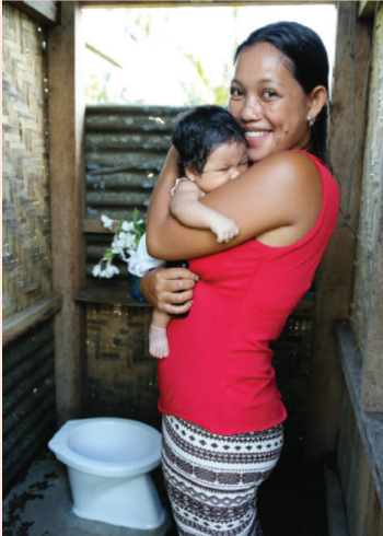
ម្តាយ និងកូនឈរនៅជិតបង្គន់សង់ថ្មីនៅតំបន់ដែលរងការវាយប្រហារដោយព្យុះហៃយ៉ាន, UNICEF ហ្វីលីពីន ២០១៤។