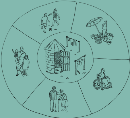
Illustration by Jamie Eke

ដើម្បីសម្រេចលទ្ធភាពទទួលបានអនាម័យគ្រប់គ្រាន់ និងប្រកបដោយសមធម៌ សម្រាប់មនុស្សគ្រប់រូប និងការបញ្ឈប់ការបន្ទោរបង់ពាសវាលពាសកាលចាំបាច់ ត្រូវផ្ដោតការយកចិត្តទុកដាក់ជាពិសេសលើក្រុមជួបការលំបាក។ ច្បាស់ណាស់ថា អត្ថប្រយោជន៍នៃការរៀបចំកម្មវិធីអនាម័យជនបទ និងការផ្តល់សេវាកន្លែងមក ច្រើនតែមានរបាយមិនស្មើគ្នា និងបង្កជាហានិភ័យនៃការមិនអើពើចំពោះក្រុមជួប ការលំបាក។ កម្រងឯកសារ “ព្រំដែន នៃកម្មវិធីសហគមន៍ ដឹកនាំអនាម័យ ទាំងស្រុង” ពិនិត្យមើលសក្តានុពល នៃការរៀបចំយន្តការគាំទ្រដើម្បីជួយ ឱ្យក្រុមជួបការលំបាក មានលទ្ធភាព និងបានប្រើប្រាស់បង្គន់អនាម័យឆ្ពោះ ទៅរកការជំរុញ លទ្ធផលអនាម័យ ជនបទ ដែលកាន់តែមានសមធម៌។ កម្រងឯកសារនេះ លើកឡើងពីការ ពិចារណាថ្មីៗស្តីពីឱកាស និងបញ្ហា ប្រឈមនៃយន្តការគាំទ្រ ព្រមទាំង ស្វែងយល់ពី កិច្ចការដែលត្រូវធ្វើបន្ត ទៀត។