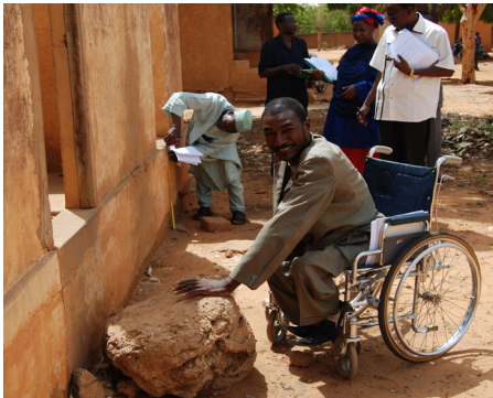
ការសង់បង្គន់សម្រាប់ជនពិការក្នុងទីក្រុង ដាកា ប្រទេសបង់ក្លាដេស។

លើកកម្ពស់បច្ចេកវិទ្យាអនាម័យបរិយាប័ន្ន៖ ជនពិការ ប្រហែលជាត្រូវការការរៀបចំផែនការ និងថវិកាជាក់លាក់ក្នុងអន្តរាគមន៍នានាដើម្បីបំពេញតម្រូវការរបស់ពួកគេ។ អ្នកអនុវត្តន៍ អ្នកដឹកនាំមូលដ្ឋាន និងអ្នកផ្សេងទៀត ប្រហែលជាត្រូវការការកសាងការយល់ដឹង និងការបណ្តុះបណ្តាលដែលគិតគូរពីជនពិការ ហើយប្រហែលជាត្រូវធ្វើការវាយតម្លៃបែបចូលរួមលើឧបសគ្គរាំងរាងភាពងាយស្រួលប្រើប្រាស់។ មួយវិញទៀត ប្រហែលជាត្រូវបណ្តុះបណ្តាលជាងសំណង់ក្នុងមូលដ្ឋានដើម្បីឱ្យពួកគេអាចសង់បង្គន់ដែលគិតគូរពីជនពិការ។ ផ្នែកនេះត្រូវបានលើកមកពិភាក្សាលម្អិតក្នុងឯកសារទី ៣ នៃកម្រងឯកសារ “ព្រំដែននៃកម្មវិធីសហគមន៍ដឹកនាំអនាម័យទាំងស្រុង” “ពិការភាព៖ ការធ្វើឱ្យកម្មវិធីសហគមន៍ដឹកនាំអនាម័យទាំងស្រុងមានលក្ខណៈបរិយាប័ន្នពេញលេញ”។