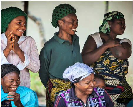
ស្ត្រីកំពុងចូលរួមក្នុងព្រឹត្តិការណ៍បំផុសសហគមន៍ដឹកនាំ អនាម័យទាំងស្រុងក្នុងតំបន់រដ្ឋាភិបាលមូលដ្ឋាន Obanliku ប្រទេសនីហ្សេរីយ៉ា។

តារាង ១ រៀបរាប់ពីមធ្យោបាយផ្សេងៗក្នុងការកំណត់អត្តសញ្ញាណក្រុមជួបការលំបាក និង គុណសម្បត្តិ និងគុណវិបត្តិនៃមធ្យោបាយទាំងនោះ។