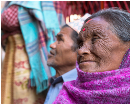
ការពិគ្រោះយោបល់ជាមួយបុរស និងស្ត្រីចំណាស់ក្នុង ទីក្រុងកាត់ម៉ាន់ឌូ ប្រទេសនេប៉ាល់។