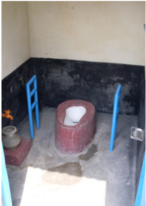
ការសង់បង្គន់សម្រាប់ជនពិការក្នុង ទីក្រុង ដាកា ប្រទេសបង់ក្លាដេស។