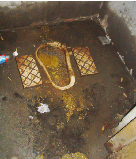
បង្គន់រណ្តៅដែលពេញប្រៀប ភូមិ Syedpur ប្រទេសបង់ក្លាដេស។

បញ្ហាប្រឈម៖ ស្ថានភាពនៃការគ្មានការបន្ទោបង់ពាសវាលពាសកាល ច្រើនតែត្រូវបានវាស់វែងរៀបរយនឹងថាតើមនុស្សគ្រប់រូបក្នុងសហគមន៍មួយមានបង្គន់អនាម័យ ឬទេ ប៉ុន្តែជាទូទៅ សមាជិកគ្រួសារមួយចំនួនប្រើប្រាស់បង្គន់មិនជាប់លាប់នោះទេ (Chambers and Myers 2016)។ ភាពក្រីក្រ អាយុ ពិការភាព និងយេនឌ័រ សុទ្ធតែអាចរួមចំណែកមួយផ្នែកដល់ការប្រើប្រាស់បង្គន់។ ឯកសារទី៧ នៃកម្រងឯកសារ “ព្រំដែននៃកម្មវិធីសហគមន៍ដឹកនាំអនាម័យទាំងស្រុង “បទដ្ឋានចំណេះដឹង និងការប្រើប្រាស់” ផ្តោតលើអ្នកលើបញ្ហានេះ និងដំណោះស្រាយនានា។ ការពង្រឹងបរិយាកាស អំណោយផល ដើម្បីធានាអាកប្បកិរិយា និងការជួសជុលថែទាំប្រសើរតាមបែបបច្ចេកទេស (ឧ. ការសម្អាតរណ្តៅបង្គន់) ជាប្រការសំខាន់ក្នុងការជំរុញការប្រើប្រាស់បង្គន់ជាប់លាប់ ដូចមានពិភាក្សាក្នុងឯកសារទី ៤ នៃកម្រងឯកសារ “ព្រំដែននៃកម្មវិធីសហគមន៍ដឹកនាំអនាម័យទាំងស្រុង៖ និរន្តរភាព និងសហគមន៍ដឹកនាំអនាម័យទាំងស្រុង៖ ការគិតគូរពិចារណា” (Cavill et al. 2015)។