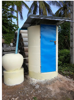
បង្គន់កងល្អៗ ជម្រើសដែលកាន់តែ សាមញ្ញ និងមានតម្លៃសមរម្យ។ ក្រុម្រឹត៖ IDE Cambodia

ធ្វើការអង្កេតបណ្តើរៗ៖ អាចប្រកិរិយា ឥរិយាបថ ចំណេះដឹង និងការអនុវត្តដែលពាក់ព័ន្ធ នឹងអនាម័យ មានលក្ខណៈផ្អែកតាមបរិបទបំផុត។ អាចធ្វើការស្រាវជ្រាវបណ្តើរៗដើម្បី ស្វែងយល់កាន់តែច្បាស់ពីចំណុចទាំងនេះ និងរបៀបដែលចំណុចទាំងនេះប្រែប្រួល តាមក្រុមនានា ដើម្បីផ្តល់មូលដ្ឋានព័ត៌មានដល់ការដាក់បញ្ចូលយន្តការគាំទ្រចម្រុះ និង ទទួលបានធាតុចូលពីអ្នកដែលអាចក្លាយជាអ្នកទទួលបានផល។ ឧ. សូមមើលការស្រាវជ្រាវ របស់ SNV ស្តីពីការប្រើប្រាស់បង្គន់ និងការលាងសម្អាតដៃជាមួយនឹងសាប៊ូ ដែល ស្រាវជ្រាវពីភាពខុសគ្នាក្នុងចំណោមក្រុមជាតិពន្ធនិងក្រុមសាសនានៅប្រទេសនេប៉ាល់ (SNV, 2015)។ ការជំរុញឱ្យរដ្ឋាភិបាលមូលដ្ឋានចូលរួមក្នុងការស្រាវជ្រាវនេះ អាចផ្តល់ លទ្ធផលរៀនសូត្រផ្អែកតាមបទពិសោធន៍ដើម្បីជំរុញការប្តេជ្ញាចិត្តរបស់អ្នកដឹកនាំមូលដ្ឋាន ក្នុងការចូលដល់ជនគ្រប់រូប។