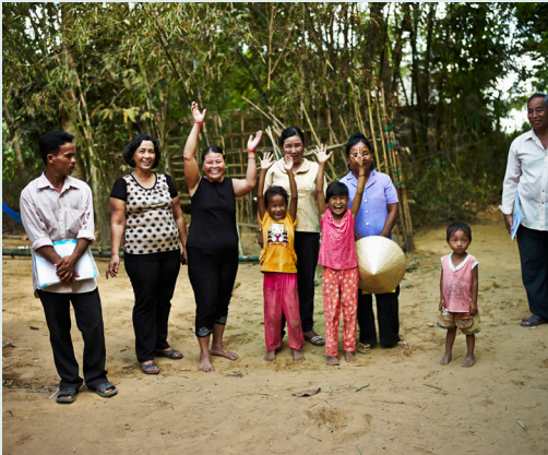
គ្រួសារក្នុងកម្មវិធី CHOBA ដែលរស់នៅក្នុងខេត្តត្រាវិញ ប្រទេសវៀតណាម។

ទិដ្ឋភាពរួមនៃកម្មវិធី៖ កម្មវិធី CHOBA ត្រូវបានបង្កើតឡើងដោយមូលនិធិ EMW ដោយ អនុវត្តវិធីសាស្ត្រផ្អែកលើលទ្ធផល (OBA) ដើម្បីឱ្យគ្រួសារនានា ជាពិសេសគ្រួសារ ជនបទក្រីក្រមានបង្គន់អនាម័យ។ សកម្មភាពបំផុសដែលស្រដៀងគ្នានឹងសហគមន៍ ដឹកនាំអនាម័យទាំងស្រុង ត្រូវបានយកមកអនុវត្តដើម្បីបំផុសការស្តាប់ខ្លឹមការបន្ទោរ បង់ពាសវាលពាសកាល់ និងលើកកម្ពស់ឥរិយាបថអនាម័យល្អ។ គ្រួសារក្រីក្រមាន លក្ខណៈសម្បត្តិទទួលបានប្រាក់កម្ចីតាមរយៈរដ្ឋាភិបាលមូលដ្ឋាន ហើយអ្នកដែល ទិញសម្ភារៈសង់បង្គន់ទទួលបានការបង្វិលប្រាក់ជូនវិញចំនួន ២៨ដុល្លារ។ ចំណាយ ក្នុងកម្មវិធីនេះគឺប្រហែល ៥០ ដុល្លារ/គ្រួសារ។ មូលនិធិ EMW បានផ្តល់ការផ្ទេរថវិកា ដោយមានលក្ខខណ្ឌដល់ឃុំដែល សម្រេចបានកំណើនវិសាលភាព អនាម័យ៣០ % ធៀបនឹងចំណុច ដៅគោល និងការផ្ទេរថវិកាដោយ មានលក្ខខណ្ឌ មួយផ្សេងទៀត ប្រសិនបើ ពួកគេសម្រេចបាន វិសាលភាព អនាម័យ ៩៥%។ កម្មវិធីនេះ បានគាំទ្រដល់ការ បណ្តុះបណ្តាលជាងសំណង់ក្នុង មូលដ្ឋានស្តីពីការសង់បង្គន់ និង ជំរុញឱ្យសហគមន៍វៀតណាម (VWU) ចូលរួមលើកកម្ពស់ ការ មានបង្គន់ប្រើប្រាស់ និងអនាម័យ