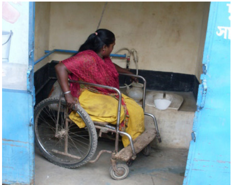
ការត្រួតពិនិត្យភាពងាយស្រួលប្រើប្រាស់ ប្រទេសនីហ្សេរ។

ជំរុញការចូលរួមរបស់អង្គការតស៊ូមតិក្នុងមូលដ្ឋាន៖ ការជំរុញការចូលរួមរបស់អង្គការមូលដ្ឋាន ដែលមានបទពិសោធន៍លើការធ្វើការជាមួយ និងតស៊ូមតិគាំទ្រក្រុមជួបការលំបាកជាក់លាក់ អាចជួយដល់ការកំណត់ករិយាល័យដែលមានប្រសិទ្ធភាព និងផ្តល់ការគោរព ដើម្បីធ្វើយ៉ាងណាឱ្យក្រុមជួបការលំបាកទទួលបានអត្ថប្រយោជន៍ ពីអន្តរាគមន៍អនាម័យជនបទ។ ឧ. អង្គការជនពិការនៅកម្ពុជា (DPO) នៅថ្នាក់ស្រុកបានជួយឱ្យមានការផ្តោតការយកចិត្តទុកដាក់លើក្រុមទាំងនេះ (ISF-UTS and SNV, 2018)។