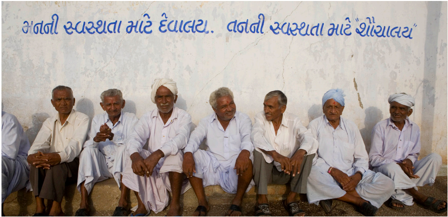
យុទ្ធនាការអនាម័យ៖ បុរសអង្គុយខាងក្រោមសញ្ញាដែលសរសេរថា "ដើម្បីសម្អាតព្រលឹងរបស់អ្នក អ្នកត្រូវការព្រះវិហារ ដើម្បីសម្អាតរាងកាយរបស់អ្នក អ្នកត្រូវការបង្គន់" ក្នុងភូមិ Rajpara Bhayati ប្លុក Vallabhipur ឆ្នាំ ២០០៨។