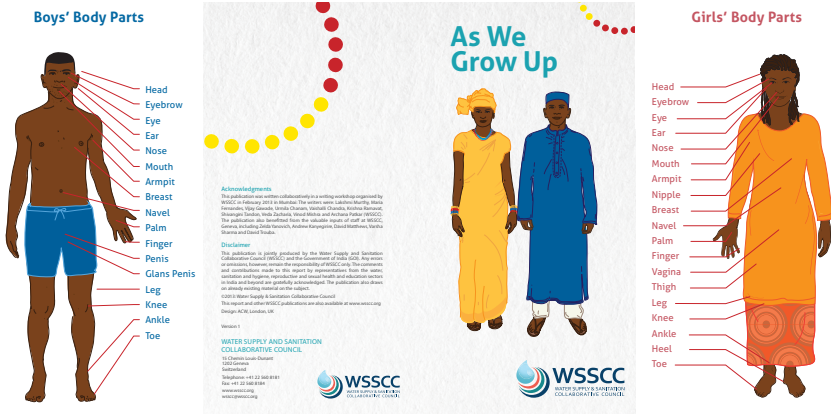
'As We Grow Up'.