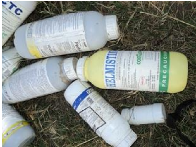
Envases de agroquímicos utilizados en la comunidad

Otro riesgo importante es la contaminación que fue ya mencionada en varias entrevistas. Muchas de las legumbres e incluso el maíz tradicional se fue perdiendo dicen a causa de la contaminación de dos orígenes. La de las ladrilleras que están avanzando hacia la comunidad, y la de las tierras por uso de productos químicos y de residuos de desechos de pollo de las empresas instaladas en la zona.