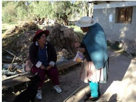
Entrevista a profundidad realizada en colaboración con la técnico local