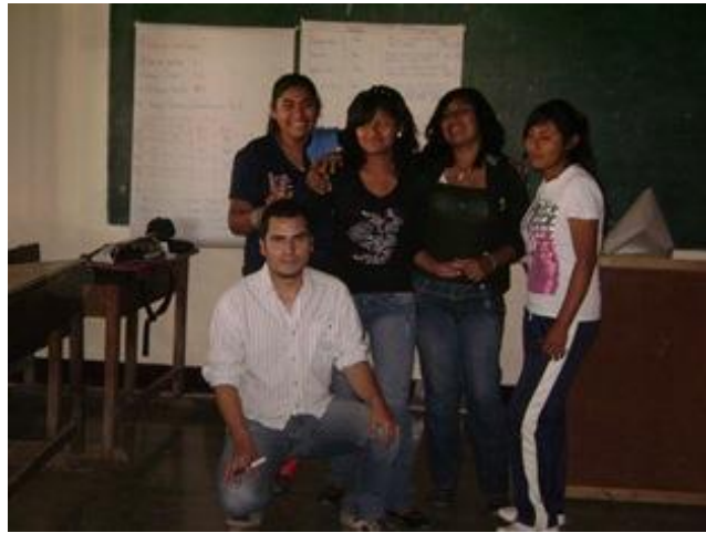
Grupo focal Jovenes depues de la Realizacion del trabajo

En el Grupo focal de jóvenes han coincidido con esta visión. Uno de los problemas mas importantes es la escasez de trabajo y el segundo es el aumento de los precios de los alimentos y también del transporte.