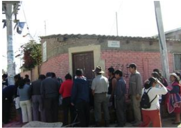
Grupo de inquilinos haciendo fila para comprar gas ( ellos no cuentan con el gas domiciliario que solo beneficia al propietario de casa )

Un grupo poblacional aparentemente importante por su número son los inquilinos. Según Richard Baptista ( presidente de la OTB Kami), la mayoría de los propietarios, ex mineros tienen entre uno y 4 inquilinos, como forma de aumentar sus ingresos. Sin embargo, no se sabe más sobre esta población mas o menos flotante. Entre ellos encontramos, estudiantes, parejas recién formadas, profesionales, albañiles y trabajadoras del hogar.