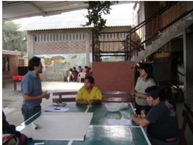
Grupo de Madres ( Senda Nueva) que explicaron sobre los créditos que reciben

Este programa tiene además otros dos componentes. Algunas mamás hacen pan para la venta y también los grupos de madres que lo desean pueden sacar créditos alimenticios. Los créditos son de 500 bs. Pero tienen que sacar en grupo de mujeres después de indicar en que clase de alimentos y el presupuesto que quieren utilizar.