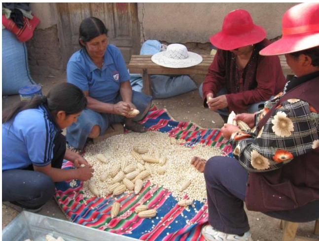
Desgranando maíz en casa de L.

Creo que este proyecto por tratarse de un tema que integra lo público y lo privado la producción con la estrategias de reproducción, lo social y lo económico es una oportunidad importante para revisar lo que consideramos metodologías participativas e intercambiar más nuestras experiencias.