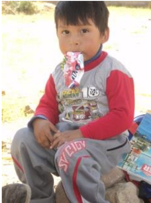
Niño de la Comunidad consumiendo un producto industrial en el recreo

El cambio de precios por la estacionalidad de los productos es lo más frecuente en esta área, no son evidentes subidas y bajadas bruscas en los productos de su canasta familiar. Su mercado de abastecimiento es Quillacollo y allí asisten en la mayoría de los casos en día de ferias (sábado y domingo) los campesinos productores de otras zonas, ofertando productos a “mejor precio”.