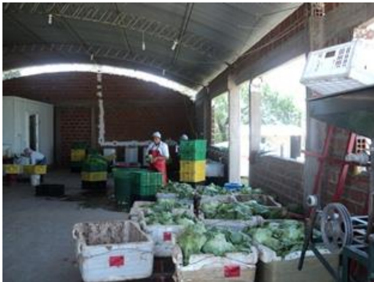
Instalaciones de la empresa agroindustrial Agua Pura

Un tercer riesgo es que las empresas agroindustriales que se han instalando en la zona crezcan más a costa de la compra de tierras de los campesinos.