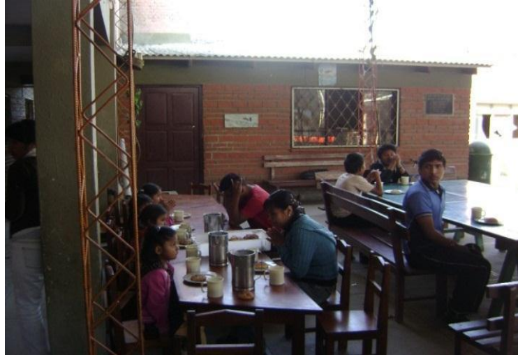
Instalaciones del Programa Senda Nueva que funciona en la Parroquia