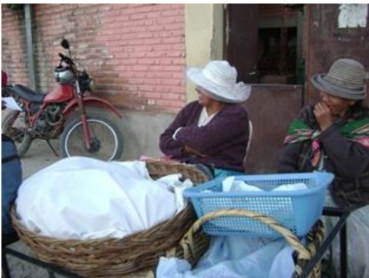
Madres del grupo de la Parroquia vendiendo pan

Hemos ido a EMAPA. Por ejemplo cuando subió el precio del pan el Párroco consiguió un pequeño financiamiento para ayudar a los más pobres. El párroco fue a verlos, a los de EMAPA, queríamos sacar la harina de EMAPA..... hayyyyy no sabes! ..... Pensábamos hacer pan comprando harina, manteca, pero era muy burocrático, me pidieron solicitud aquí, formulario allá, etc., cuando ya parecía que nos iban a dar luz verde. ... No, nos decían, ha cambiado el encargado, tienen que volver a hacer. Así como tres veces no han hecho. Y ahora es igual no? (Trabajadora Social de la Parroquia)