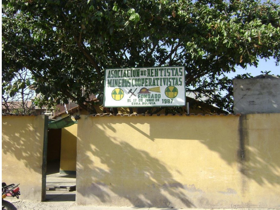
Frontis de la sede de la Asociación de rentistas