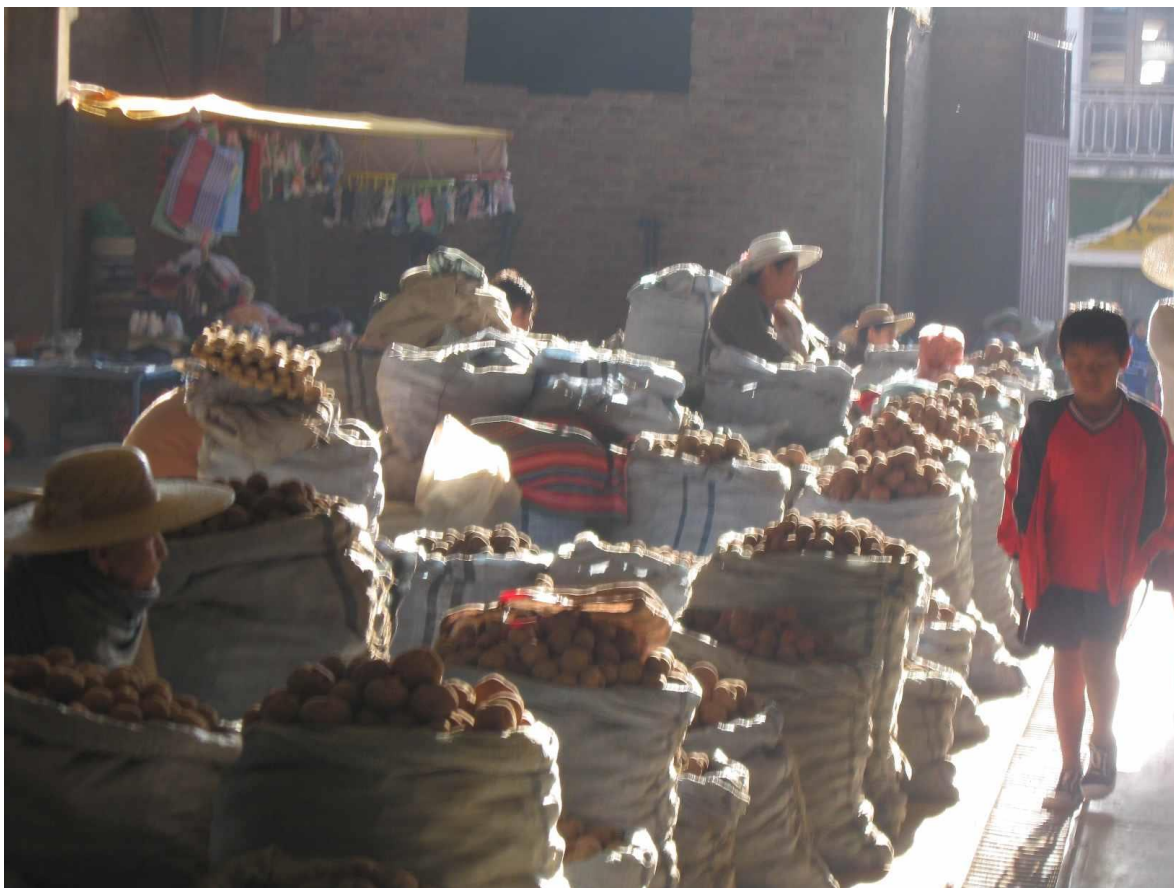
Mercado Quillacollo.