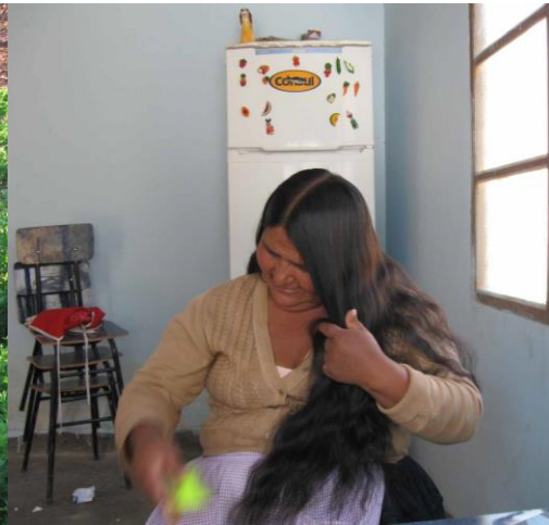
M. se peina, mientras responde