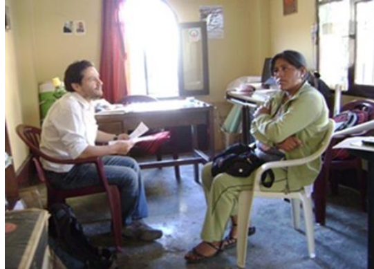
Aplicacion de la canasta familiar en una entrevista con Snra R.

En la comunidad Pirhuas: Entrevistas en profundidad canasta familiar, precios de alimentos, genealogías.