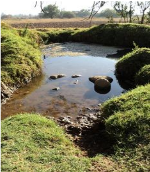
Fuente de agua de la Comunidad

Uno de los riesgos más grandes en la comunidad, es el que se quede sin agua. Las fuentes principales de agua son subterráneas y tienen 4 pozos profundos a 100 y 200 metros, lo que para esta región ya es una señal de agotamiento de las fuentes.