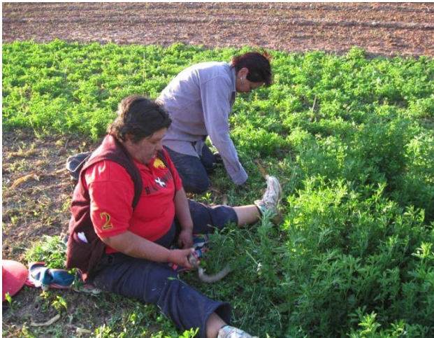
Cortando alfa, en la parcela de Sr C.