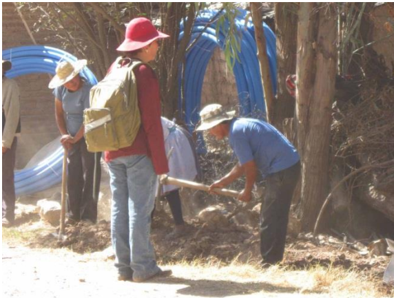
Acompañando el trabajo comunal