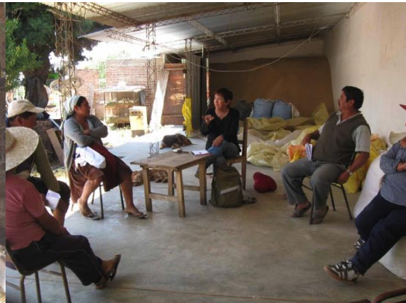
Reunión con grupo de lecheros