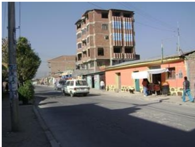
Av. Oquendo –calle principal del Barrio Kami

Debido a la falta de datos, la composición etárea de la población es desconocida inclusive para el subcalde. Los colegios de la zona reciben a alumnos de todo el distrito y algunos de más lejos. Además algunos jóvenes del distrito pueden asistir otros colegios y escuelas.