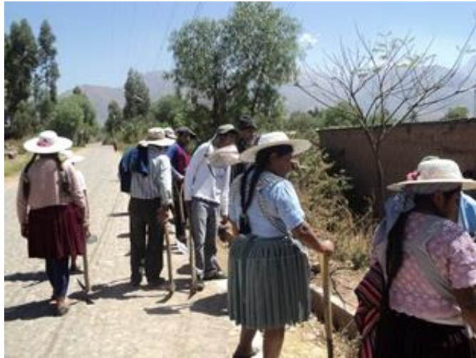
Mujeres de la comunidad trabajando en actividades comunales

Este es un tema que merecería mayor investigación, de lo que se logró en este primer acercamiento; podemos decir que la migración de los esposos hacia otras fuentes de producción y negocios, como las minas en la paz, la compra y venta de terrenos en Santa Cruz y la instalación de negocios allá, como la dedicación al transporte, parecen ser causas para que algunos varones formen otras familias y abandonen a las mujeres con la carga de la producción agrícola.