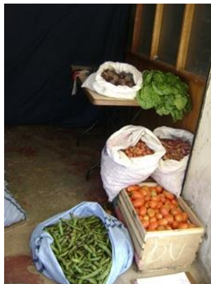
Puesto de venta de verduras Kami

“Yo me he dado cuenta que los precios suben por temporadas no más, a veces hay semanas que voy al mercado y todo ha subido, voy de dos semanas y ha bajado. Entonces también compensa lo que ha subido ha bajado también. Dependiendo de las cosas también suben, en la época de invierno la papa esta cara, en la época de cosecha que esta mas baja. Tenemos la ventaja de que también hay papa vieja que es más baja en tiempo de invierno tenemos esa opción de comprar, entonces se va compensando. Por ahí la carne, el pollo y eso, cuando sube ya no lo bajan el precio, muy rara vez el pollo porque hay mucha demanda” (Mujer de 45 años, tres hijos)