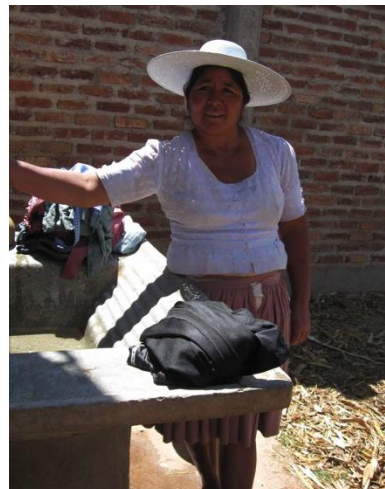
F., durante la entrevista